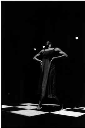
Grenn Sèl (2002)

S'immiscer dans l'univers du jeu...Trois hommes et une femme jouent à cache-cache, pour inventer de nouvelles règles aux jeux traditionnels et créer ainsi une danse inédite. « Jeu de Pichine », « Jeu de Bigidi », « Jeu de Rencontre ». Les dés sont jetés. Que la magie opère.